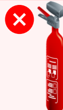
Extincteurs CO 2 et halon