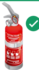
Extincteurs à poudre de 1 à 2 kg

Seuls les petits appareils extincteurs à poudre ≤ 2kg, à mousse ou eau ≤ 2L et les sphères extinctrices sont ACCEPTÉS par ECOPAE.