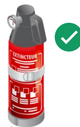
Extincteurs à mousse de 1 à 2 L