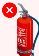
Extincteurs > à 2kg

Ces produits ne sont PAS ACCEPTÉS par ECOPAE.